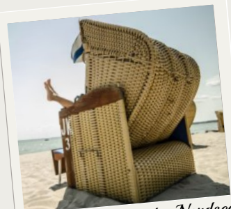
Entspannung an der Nordsee ganzjährig*

* Das Angebot gilt auch an ausgewählten Feiertagen und ist auch ohne Halbpension möglich.