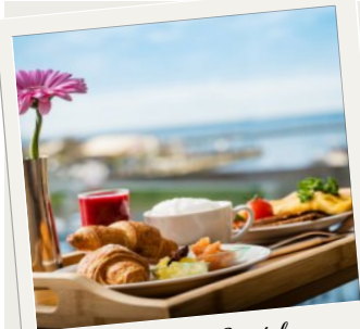
Winter - Special Jan - März | Nov - Dez