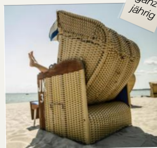
Entspannung an der Nordsee

3 x Übernachtung inkl. Frühstück 1 x Willkommensgruß auf dem Zimmer 3 x 3-Gang-Wahlmenü im Rahmen der Halbpension 1 x Glas Champagner als Aperitif zum 1. Abendessen 1 x Gezeitenplan zum Wattwandern im UNESCO Weltnaturerbe