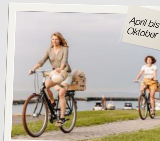
Rad & Meer